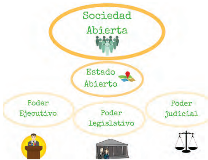
Imagen 1. La sociedad abierta