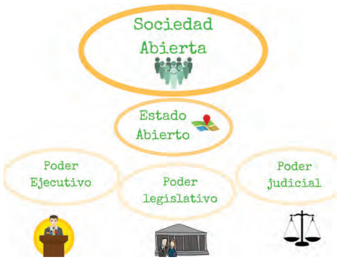
Imagen 1. La sociedad abierta

significa que el Gobierno Abierto es una manera de gobernar las sociedades en la que existe una posición más cercana entre los y las representantes que se eligen en las elecciones, las personas que trabajan en las administraciones públicas, y el resto de la ciudadanía. Además, la ciudadanía, tú, tus compañeros/as, familia, amistades, toda la sociedad, tenemos que implicarnos en el día a día del Gobierno Abierto para que sea una realidad.